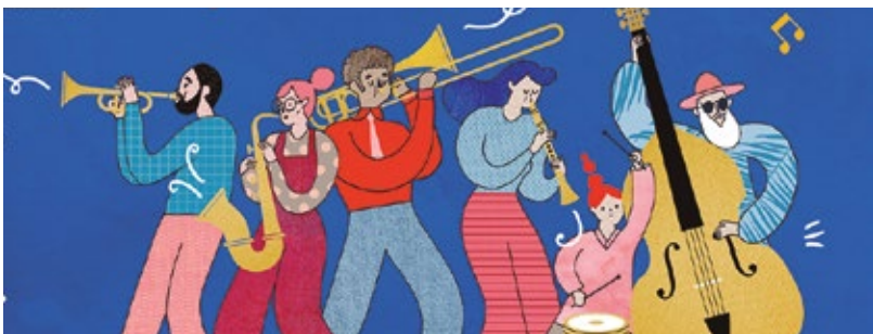
Il·lustració Judit Canela