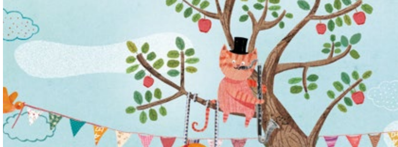
Il·lustració Txell Damé