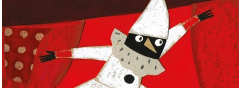
Il·lustració Carmen Queralt