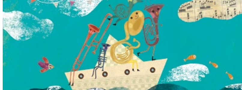
Il·lustració África Fanto

Dimarts 14 o dimecres 15 de gener de 2010 de 15h a 18h a la Sala 3 -Tete Montoliu