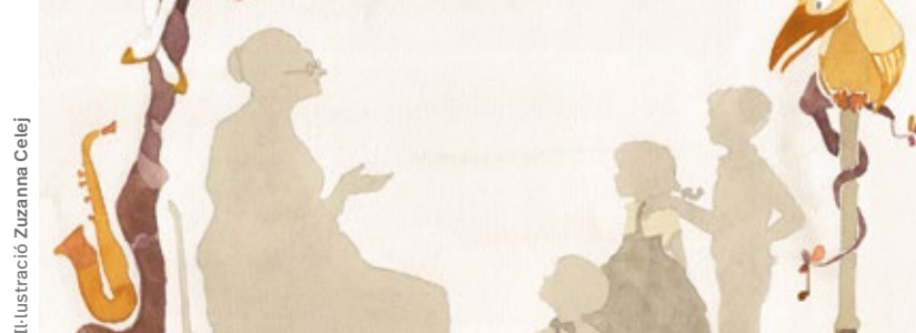
Il·lustració Zuzanna Celej

Dissabte, 19 d'octubre de 2019 de 9.30h a 14h