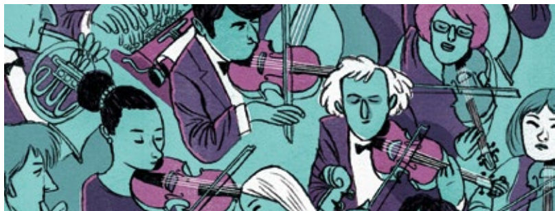
Il·lustració Martin Tognola

Més de 10 persones 10% dte. Més de 20 persones 20% dte.