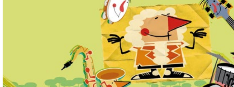
Il·lustració Oriol Malet

Sessió de formació genèrica Dissabte, 19 d'octubre de 2019 de 9.30h a 14h