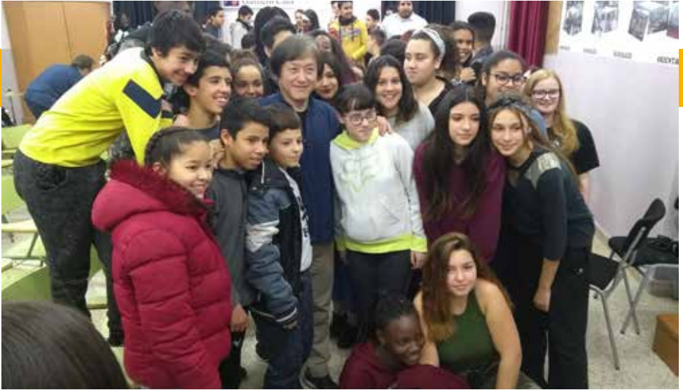
Cantaires de la Coral Escodines i de l'institut Guillem Catà amb el mestre Kazushi Ono en l'assaig que van dur a terme a Manresa.