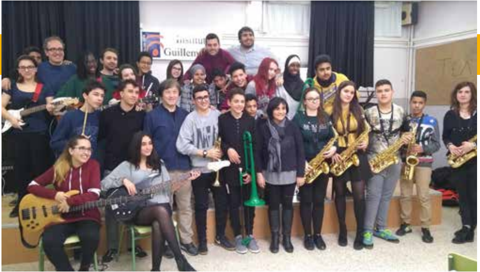
La Big Band de l'institut Guillem Catà amb el mestre Kazushi Ono durant la seva visita al centre.