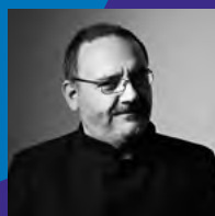
Rinaldo Alessandrini & Concerto Italiano