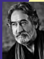
Jordi Savall, La Capella Reial & Le Concert des Nations