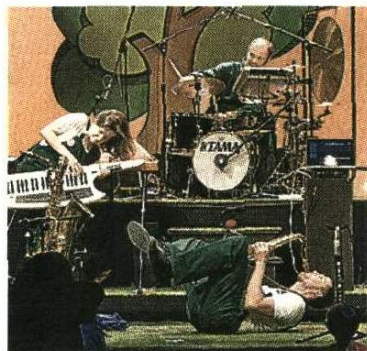
'SONA BACH'. Cinco músicos intrépidos tocan en un parque urbano.

En Sona Bach , ambientado en un parque urbano, cinco intrépidos músicos interpretan piezas del compositor. Una oportunidad increíble para disfrutar de un artista universal, a partir de una propuesta que integra el uso de