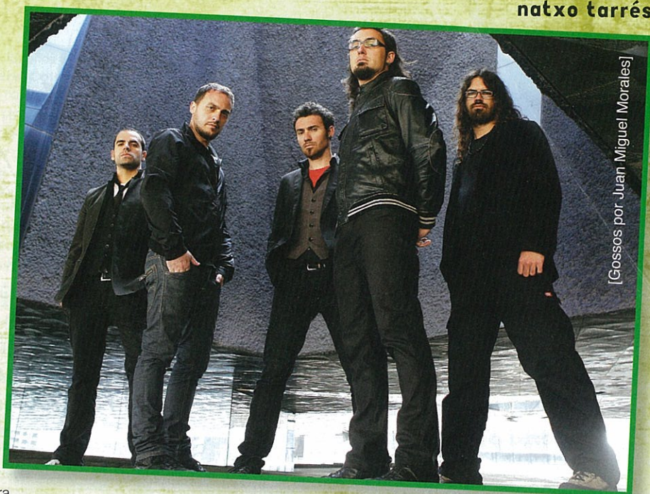
[Gossos por Juan Miguel Morales]